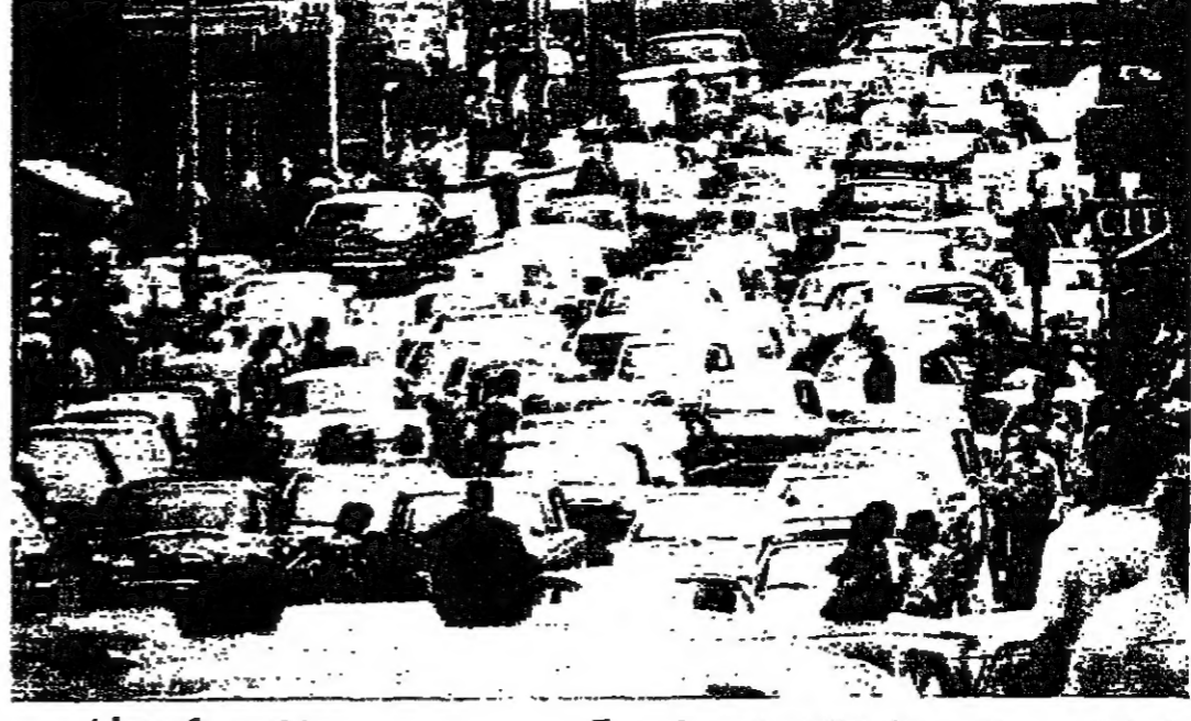
ازمة من حادة شهدتها منطقة ابريس امس